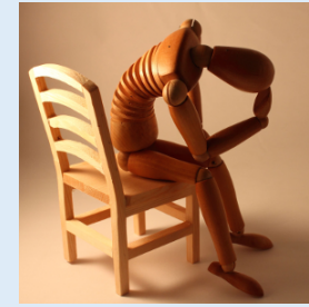
4. Emarginazione, Solitudine