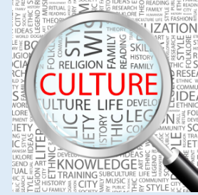
6. Cultura, impoverimento culturale