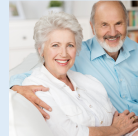
2. Anziani, invecchiamento