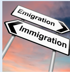
3. Immigrazione, razzismo, interculturalità