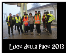
Luce della Pace 2013

A Dicembre ogni anno da quella fiamma ne vengono accese altre e vengono diffuse su tutto il pianeta come simbolo di pace e fratellanza fra i popoli.