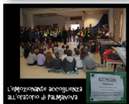
L'emozionante accoglienza all'Oratorio di PALMANOVA