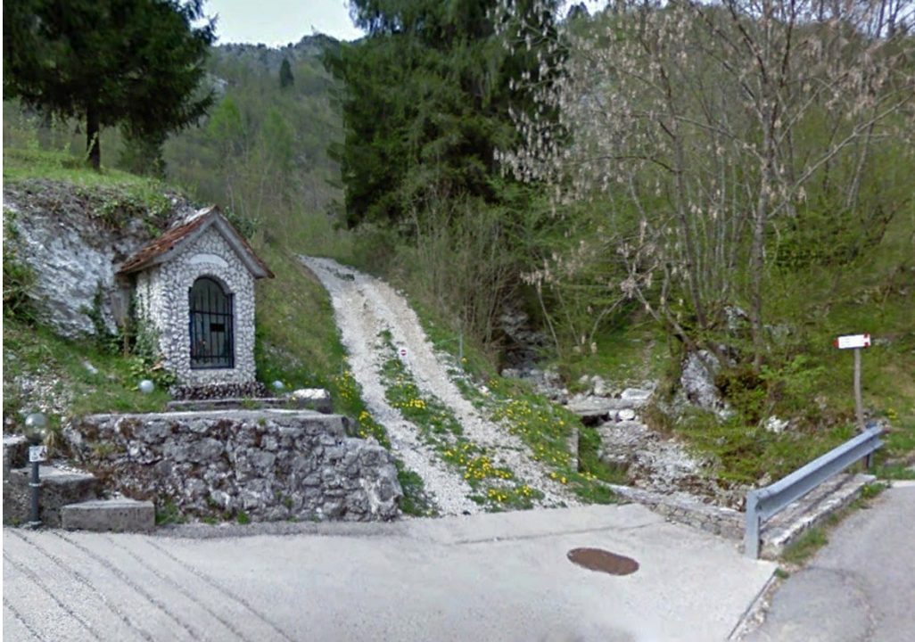
L'inizio del sentiero CAI 974a in località Roppe, Barcis (PN).