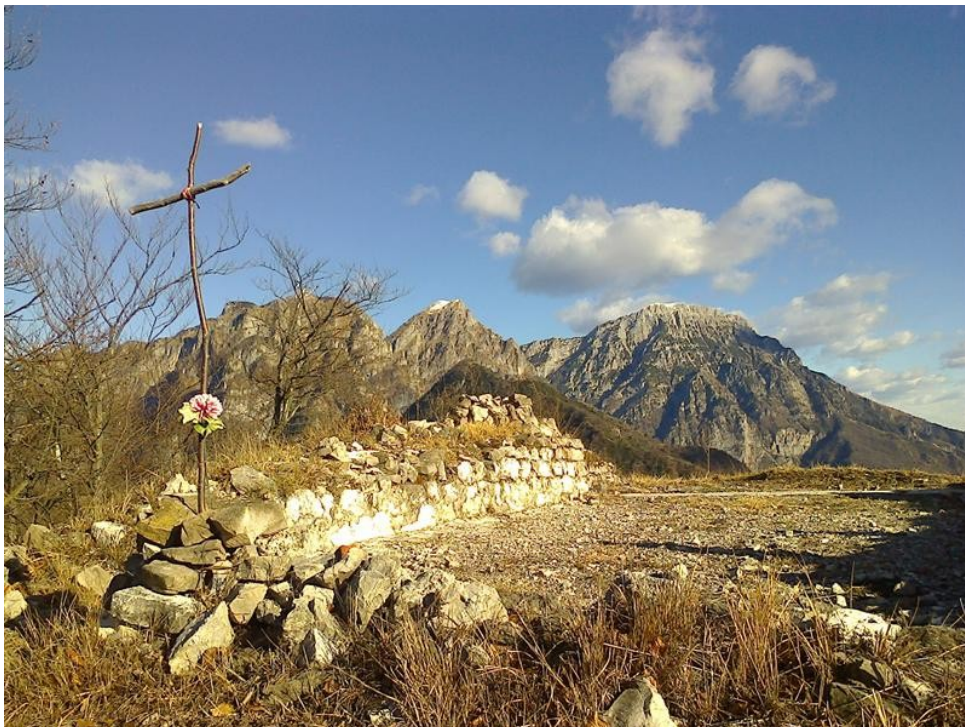
I ruderi della chiesetta di San Daniele sulla cima del monte omonimo.