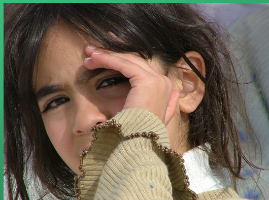
VOLTO DI SPERANZA

Lunedì 25 Maggio ore 20.30 presso Villa Tinin - Feletto Umberto