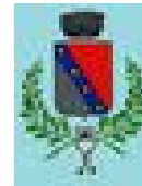
Comune di Fiume Veneto