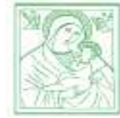
Azienda ospedaliera "S. Maria degli Angeli"