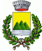
Comune di Cavasso Nuovo