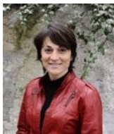
dot.ssa RAFFAELLA BASANA Assessore allo Sport, all'Educazione e agli Stili di Vita