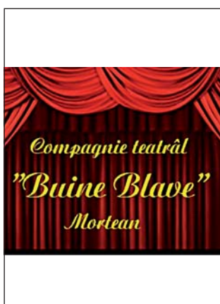
COMPAGNIA TEATRALE BUINE BLAVE

ENZO CAINERO, FRANCO CAUSIO, COMPAGNIA TEATRALE BUINE BLAVE