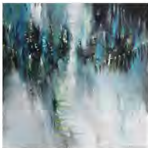
Luci su Heaven's Gate olio su tela 80 x 80

Pagina accanto: Bagliori nel buio , olio su tela 80 x 80